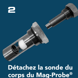
Détachez la sonde du corps du Mag-Probe®