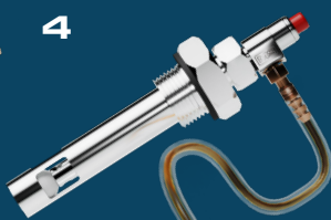
Permettez à l'huile de s'écouler librement dans le flacon d'échantillonnage